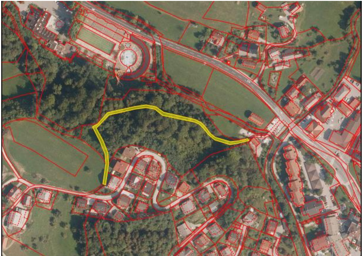
Grafični prikaz parcele: zemljišče, ki je predmet ukinitve družbene lastnine v splošni rabi

Po podatkih zemljiške knjige izhaja, da je pri parc. št. 365 k.o. 2649 Izlake vknjižena družbena lastnina v splošni rabi. Da bi bil pravni promet pri navedeni nepremičnini možen, je status družbene lastnine potrebno ukiniti.